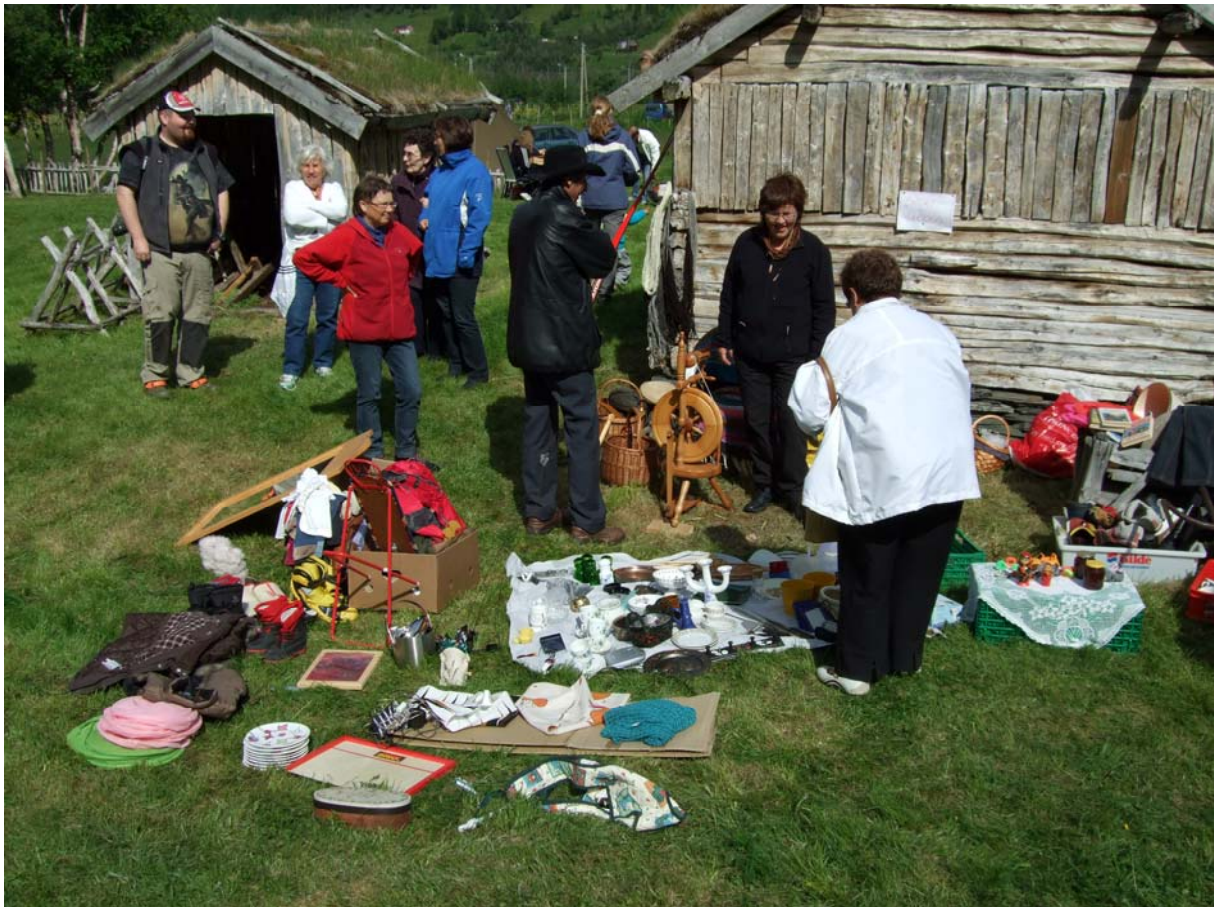
Bildet er tatt på markedsdagen på Holmenes 5.juli 2008. Årets marked var den tiende i rekken. Det var ca. 450 besøkende. Her er salget av lopper i full gang. Rundt på tunet var det salgsboder og utstillinger av diverse produkter. Besøkende kunne også få innblikk i gamle kulturtradisjoner som plantefarging, toving etc. Museet retter en stor takk til alle som støtter opp om markedsdagen!

Nord-Troms Museum er et regionsmuseum som virker over et stort område. I sommersesongen kan vi tilby aktiviteter og arrangementer over hele nord-troms. Om tilbudet i en kommune kan virke lite, er aktiviteten samlet sett meget stort. Tilbudene er varierte, spennende og ofte utført med solid kompetanse på regionens kulturhistorie. I sommersesongen er aktiviteten i museet på topp blant faste ansatte, sommerguider og frivillige fra lag og foreninger omkring i nord-troms.